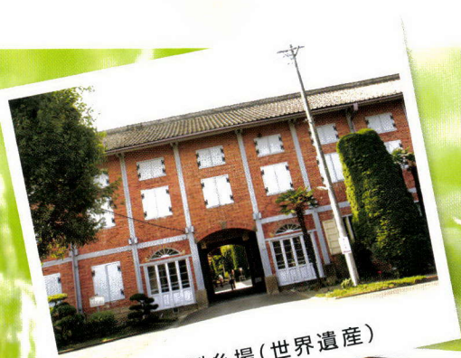
富岡製糸場(世界遺産)